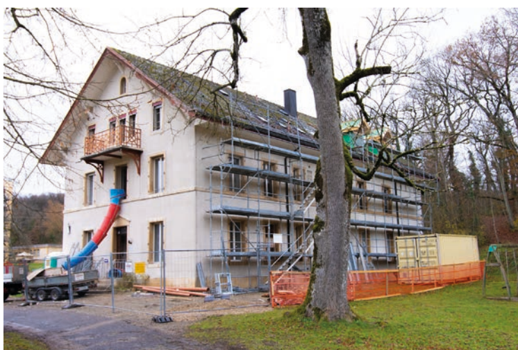
Les travaux de la Maison Butini, le 28 novembre dernier.

La réalisation de ces espaces est en lien avec les travaux de rénovation du bâtiment nécessitant une énorme implication des architectes. L'ouvrage sera terminé à la mi-juillet 2025. Nous nous réjouissons beaucoup de cette nouvelle étape et nous nous y préparons activement.