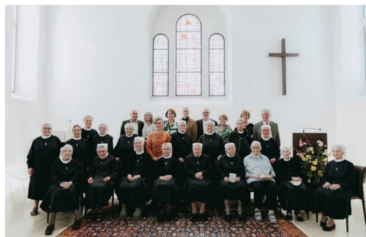
A l'issue de la cérémonie du 24 mars, une photo immortalise le nouveau visage de la Communauté.