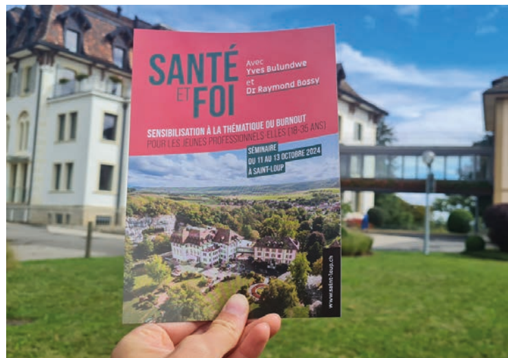
Invitation pour le séminaire « Santé et foi » d'octobre 2024